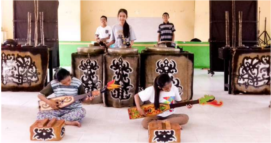
Dokumentasi Aksi Taqwin Embe: Grup pemain musik kontemporer SMP Negeri 1 Kuala Pembuang

"Saya tidak memikirkan bayaran, Mas. Kalau dihitung, tidak mungkin sebanding dengan bayaran saya melatih kesenian. Namun, saya yakin, insyaallah ada saja jalan yang diberikan Tuhan untuk saya," ucap Hari.