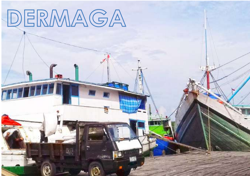
Dermaga Kuala Pempuang

S iang yang terik, tetapi tidak sepanas biasanya. Tidak terasa, sudah memasuki 12 Ramadan 1440 H. Aku memasuki dermaga dengan gladak yang sudah sangat menua. Ada beberapa potong papan yang terlepas, ada pula tambalan di mana-mana. Mengapa dermaga yang masih beroperasi setiap hari tidak begitu dirawat dengan baik? Barangkali kerap diperbaiki karena mobil bak bermuatan sangat berat kerap keluar masuk sehingga terjadilah kerusakan dan tambalan dengan papan yang berbeda.