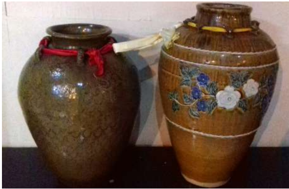
Dokumentasi pribadi: koleksi belanga di Museum Balanga Palangkaraya

Melalui belanga aku melihat sebuah kisah penciptaan dunia. Aku membayangkan, masuk ke kegelapan di dalam belanga, melayang di dalam liang seumpama alam semesta yang belum menerima setitik cahaya, Belum pula diciptakan satu pun manusia sebagai suatu bentuk kehidupan.