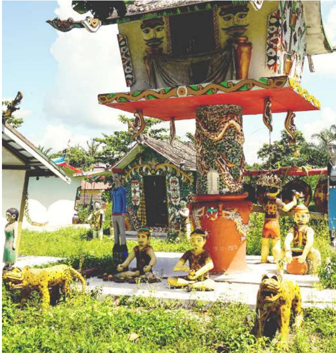
Dokumentasi Aksan Taqwin Embe: Teras, tempat penyimpanan tulang-belulang orang yang sudah meninggal—yang sudah diritualkan tiwah

Sejak dulu, Indonesia memang menjadi pusat perhatian warga asing, terutama budaya dan keseniannya. Keunikan dan kekhasan Indonesia tidak dimiliki oleh negara lain.