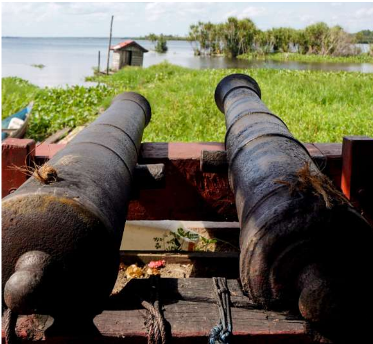
Dokumentasi Aksan Taqwin Embe: Meriam pengantin dipercaya sebagai sepasang laki-laki dan perempuan.

Kami melihat orang-orang di luar, duduk di depan motor, ada juga beberapa lelaki yang duduk di kursi di bawah pohon randu.