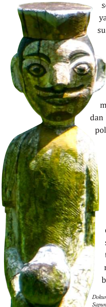
Sapunduh yang terletak di teras desa Bangkal.

Tiang pantar adalah benda yang masih dirawat dan dijaga sampai sekarang. Benda ini sebagai petanda bahwa telah usai dilaksanakan tiwah pada masa lampau. Tiang pantar itu didirikan ratusan tahun yang lalu. Pada masa lampau, untuk bisa mendirikan tiang pantar ini, dibutuhkan tumbal