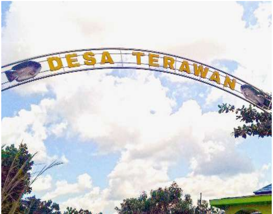
Gerbang desa Terawan