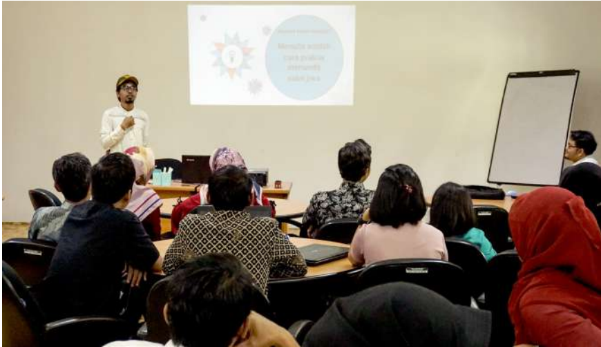
Dokumentasi Aksan Taqwin Embe:

Penulis menjadi pembicara dalam pelatihan menulis cerita pendek untuk guru TK, SD, SMP, dan SMA di Yayasan Tunas Agro, Kalimantan Tengah