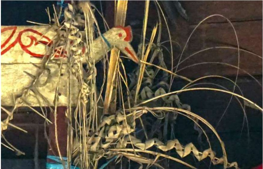
Dokumentasi Aksan Taqwin Embe: Balai di dalam rumah milik keluarga Markuni, Kepala Desa Bangkal

Balai adalah tempat menaruh sesajen. Balai ini terdapat dan lekat dengan orang yang dulunya sangat berdekatan dengan leluhur. Ada beberapa peristiwa yang misterius dan benar-benar terjadi perihal balai. Jika seseorang (pemilik) yang sudah lekat dengan balai dari turun-temurun, kemudian melepas dan tidak menggunakan balai tersebut, hal itu akan menjadi penyakit bagi diri pemilik. Hal ini mutlak dipercaya oleh orang-orang yang beragama Kaharingan. Jika balai itu tidak diisi atau disajikan makanan, itu juga akan jadi penyakit. Tentu pada akhirnya masyarakat yang memeluk agama Kaharingan tetap menjaga dan melakukan tradisi yang sudah diturunkan dari leluhur sampai entah kapan pun atau turunan yang ke berapa pun.