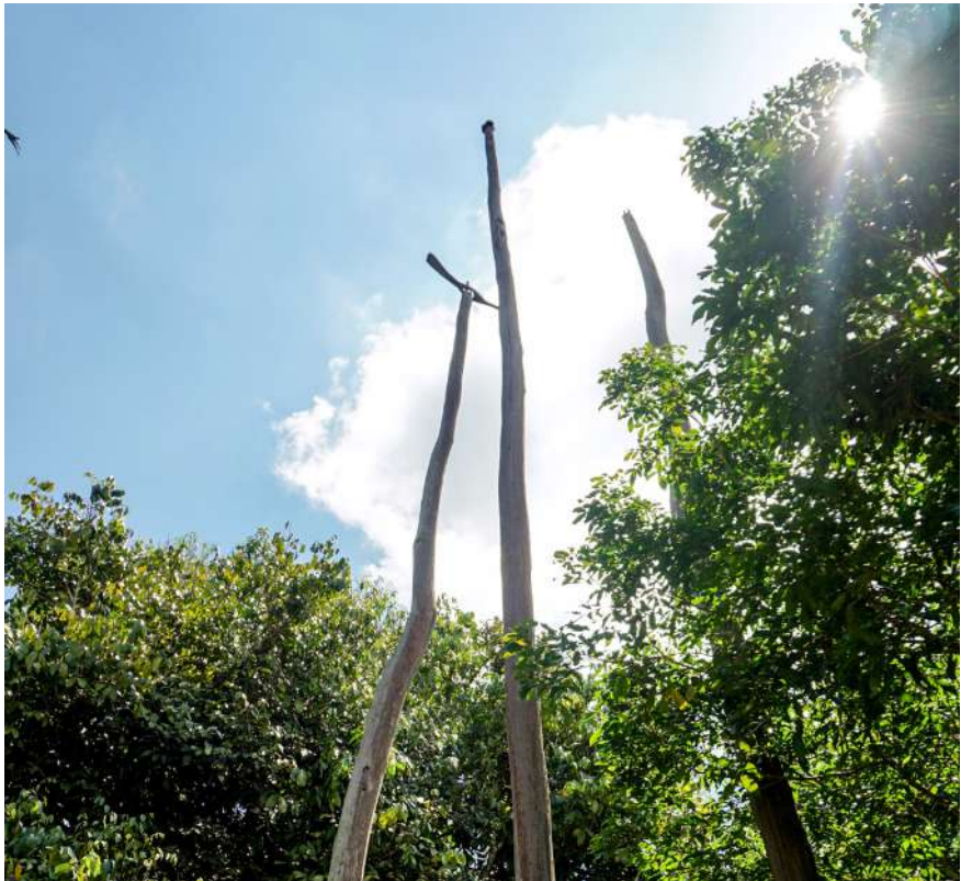
Tiang pantar yang terletak di desa Bangkal.

Di sisi lain, karena kayu ini sudah langka, orang-orang pun sudah jarang sekali yang bisa mendirikannya karena mendirikan tiang pantar membutuhkan biaya yang sangat besar. Tiang pantar yang terdapat di dalam gambar didirikan ratusan tahun yang lalu.