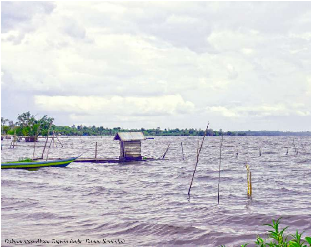
Danau Sembuluh

Tahun 1997 danau ini pernah dihajar kemarau panjang selama tujuh bulan. Ardi (45) pernah melintasi danau ini dengan berjalan kaki dari Terawan. Aku tidak bisa membayangkan bagaimana danau yang sebegitu dalam dan lebar kemudian kering seperti apa yang disampaikan Ardi.