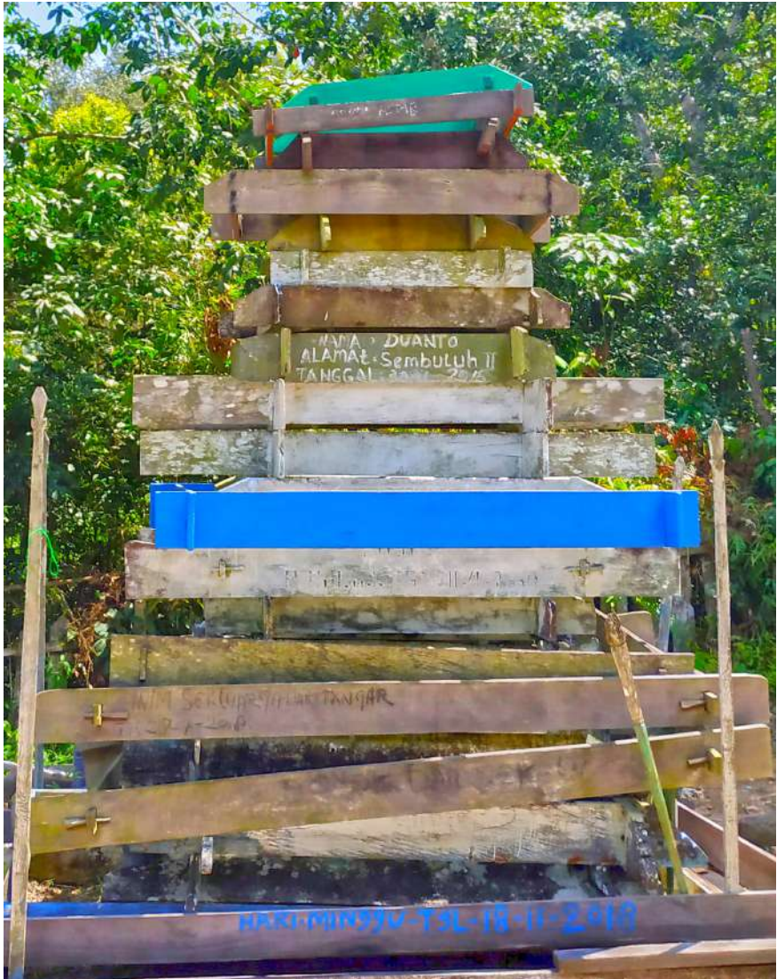
Dokumentasi Aksan Taqwin Embe