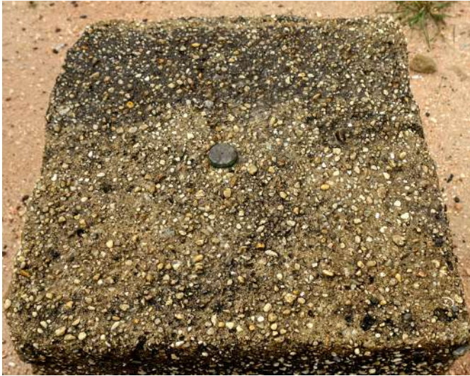
Dokumentasi Aksan Taqwin Embe: Tugu Administratif Seruyan pada masa pemerintahan Belanda

Ah, hampir saja aku lena dalam situasi yang tidak melulu diratapi. Aku lupa jika hari ini, 09 Mei 2019, ada beberapa tempat yang harus kutuntaskan. Aku ingin mengantarkan sepasang matamu ke sebuah benda yang tidak biasa di Desa Telaga Pulang.